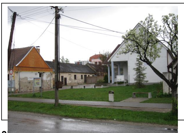
Situácia počas realizácie aktivít projektu