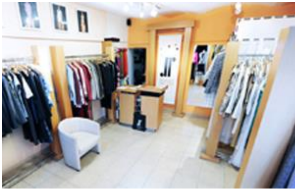
Situácia pred začiatkom realizácie aktivít projektu