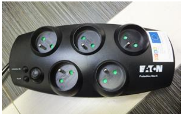
Situácia po ukončení realizácie aktivít projektu