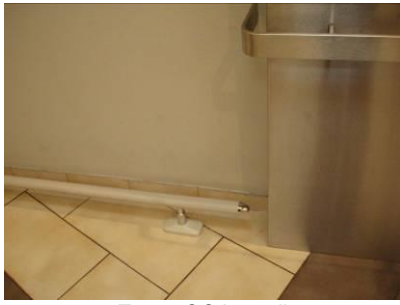
Tesco OC Lamač