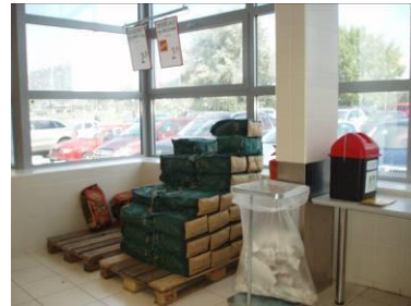
BILLA Jantárova cesta