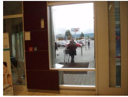
Tesco OC Zlaté pieskv