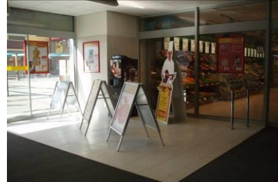
BILLA Ľudovíta Fullu