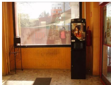
BILLA Nobelovo nám.