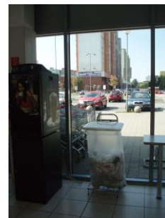
BILLA Muchovo námestie