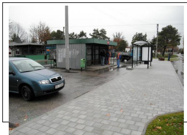
Situácia po ukončení realizácie aktivít projektu