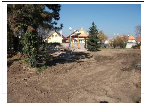
Situácia po ukončení realizácie aktivít projektu