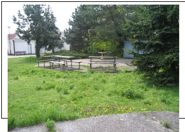
Situácia pred začiatkom realizácie aktivít projektu