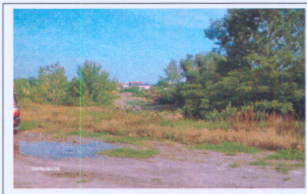
Situácia pred začiatkom realizácie aktivít projektu