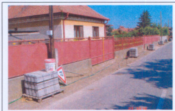
Situácia po ukončení realizácie aktivít projektu