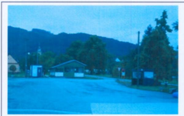
Situácia pred začiatkom realizácie aktivít projektu