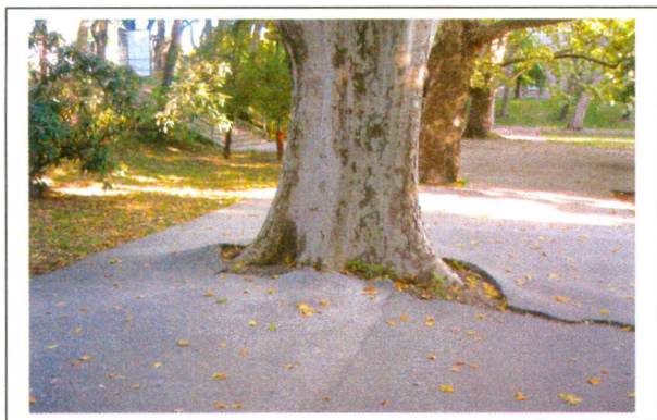
Situácia pred začiatkom realizácie aktivít projektu