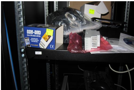
Montáž rack s vybavením