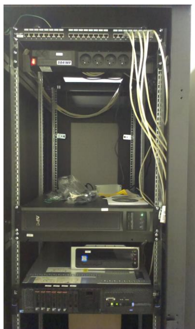
Rack s vybavením