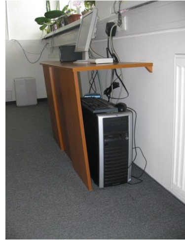
PC slúžiace ako server