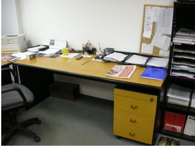
Pracovisko bez HW vybavenia