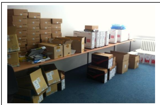
Zakúpená výpočtová technika