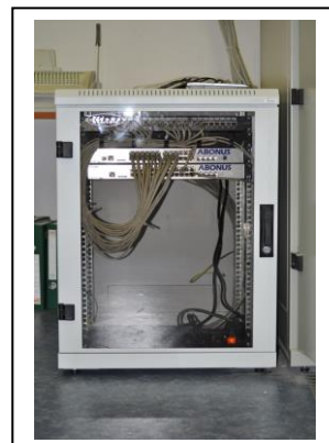
Namontovaný server siete