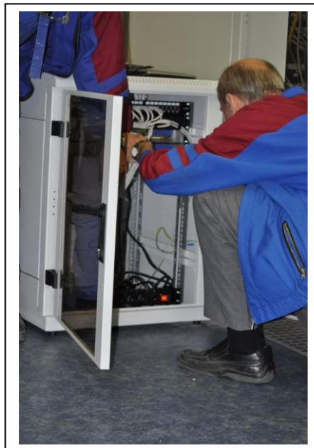
Montáž serveru siete