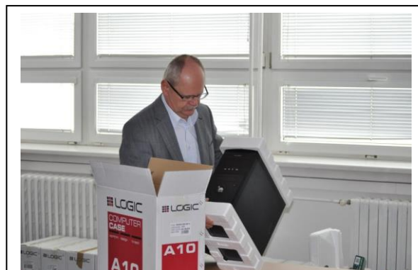
Vybaľovanie stolných PC