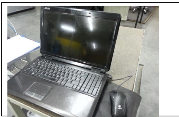
Situácia pred začiatkom realizácie aktivít projektu