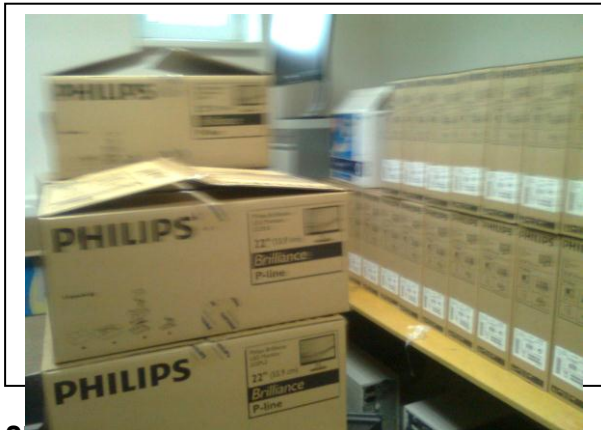
Situácia po ukončení realizácie aktivít projektu