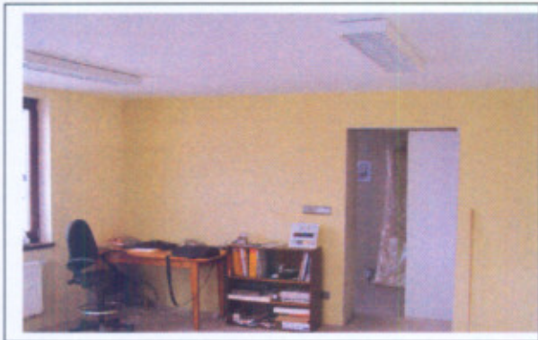
Situácia pred začiatkom realizácie aktivít projektu