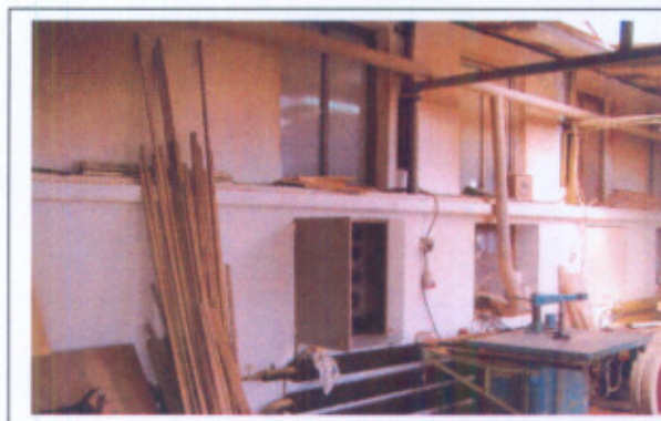
Situácia po ukončení realizácie aktivít projektu