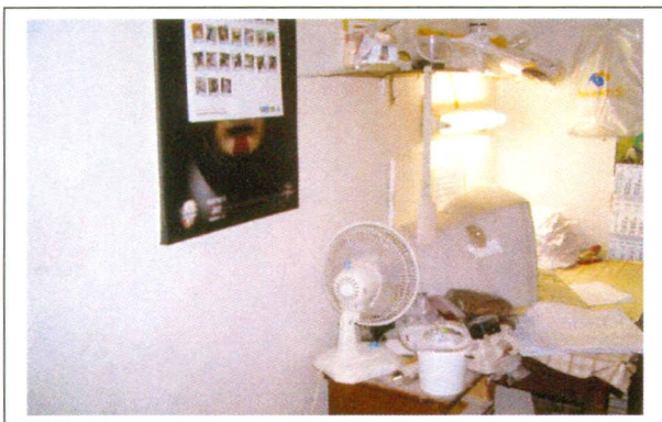
Situácia pred začiatkom realizácie aktivít projektu