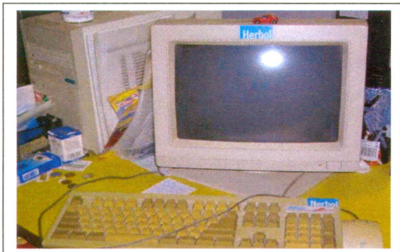
Situácia pred začiatkom realizácie aktivít projektu